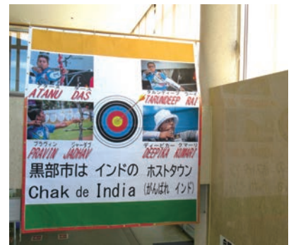
アーチェリーインド代表 応援幕

さて、昨年を顧みますと、新型コロナウイルス感染症拡大により、1年延期された東京2020オリンピック・パラリンピックが無観客という形で開催され、テレビ中継を通じて多くの競技種目に注目が集まりました。なかでも新種目のスケートボード競技やサーフィン競技、東京大会で復活した野球・ソフトボール競技などで日本中が盛り上がり、史上最多のメダルを獲得したことは記憶に新しいところであります。黒部市ではアーチェリーインド代表のホストタウンとなり、事前合宿は新型コロナウイルス感染症拡大のため中止となりましたが、体育センター内に応援ブースやビデオメッセージなどを作成し、インド代表選手を応援いたしました。