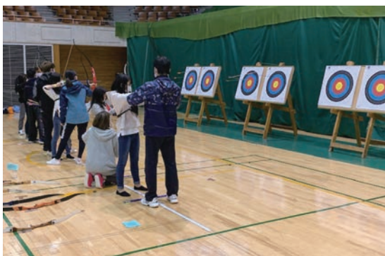
エブリバティスポーツデイ2021

新型コロナウイルス感染症の終息を願うとともに市民の皆様のみますますのご健勝とご多幸を心よりお祈り申し上げ、新年のごあいさつといたします。