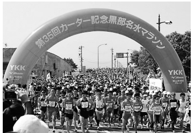
第35回カーター記念黒部名水マラソン=昨年5月27日

26日に開催することとなりました。参加されるランナーの皆様には黒部の自然や市民の温かさを堪能していただくとともに、大会を支える人、沿道で応援する人が一つとなり、笑顔あふれる大会になるよう進めてまいります。