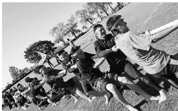
第13回黒部市市民体育大会陸上(大運動会)=昨年10月21日

結びに、市民の皆様のご健勝とご多幸を心よりお祈り申し上げ、新年のごあいさつといたします。