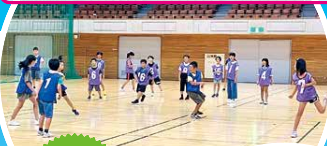
わんぱく スポーツ教室