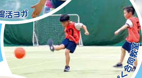
ちびっこ・わんぱく合同教室