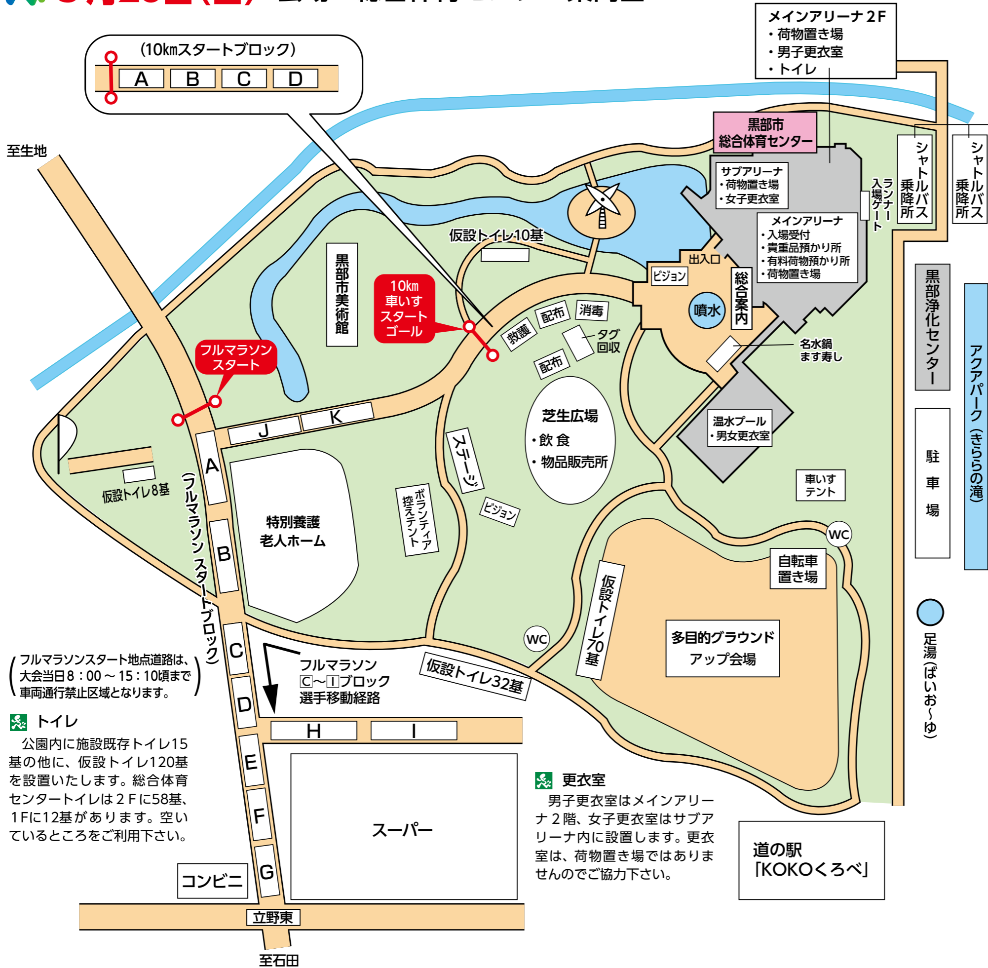
シャトルバス乗降所詳細図